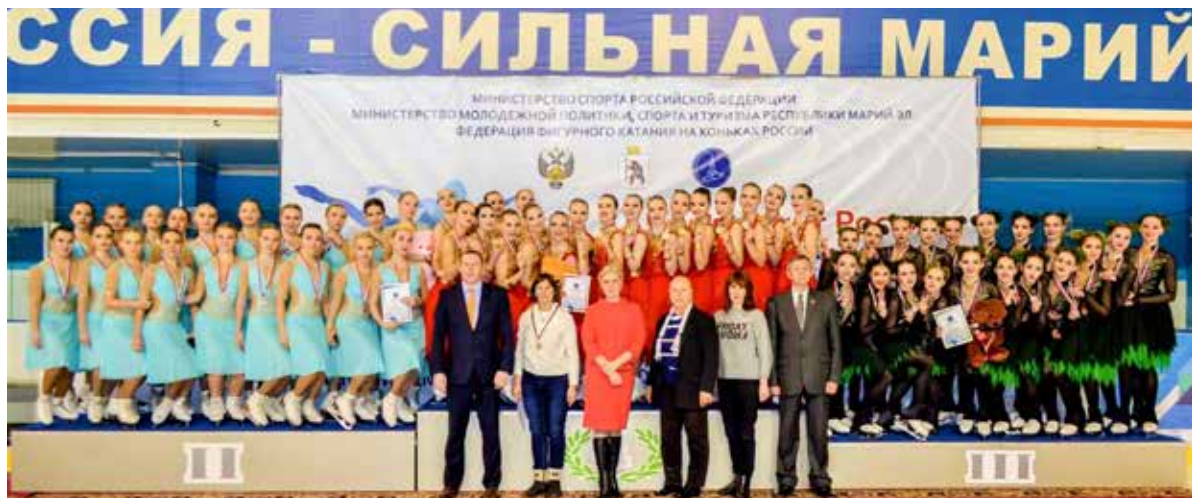
На верхней ступени пьедестала - воспитанницы «Юности»!

13 января в Йошкар-Оле завершился чемпионат России по синхронному фигурному катанию на коньках. Бороться за медали приехали лучшие коллективы страны, в их числе и воспитанницы «Юности».