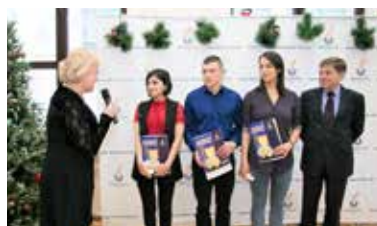
Вчерашние воспитанники «Юности» вернулись в качестве коллег