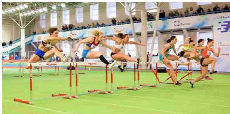
«Рождественские старты» открыты

7 января в екатеринбургском спорткомплексе «Луч» в 27-й раз прошли легкоатлетические «Рождественские старты».