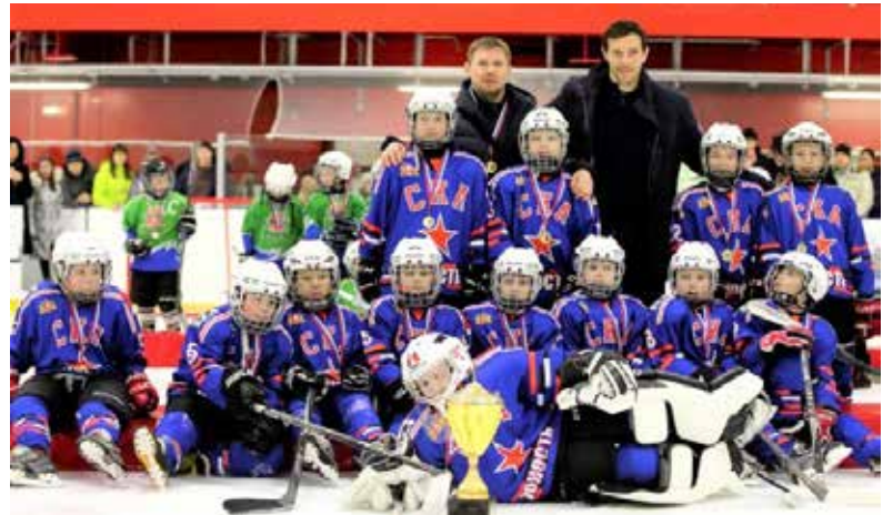
Победитель турнира - команда «Юность»