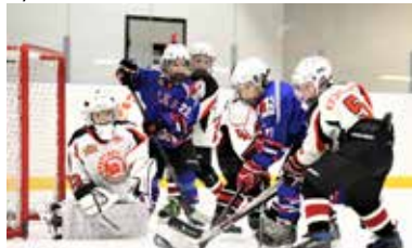
Момент финальной игры - в атаке «Юность»

По итогам матчей группового этапа в трёх группах определились полуфиналисты детского турнира, организованного по личной инициативе Павла Дацюка, и ими стали «Хризотил», «Спартаковец» и «Юность», которые вместе с нижегородской «Мечтой» разыграли путёвку в Финал.