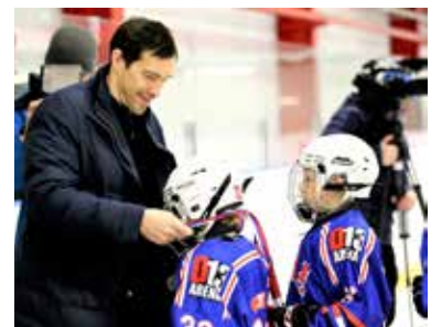
Медали от легендарного хоккеиста

торая завершилась массовым фотографированием и раздачей автографов. Победитель и призёры турнира также были награждены медалями, а все игроки получили клюшки в качестве новогоднего подарка от Павла Дацюка.